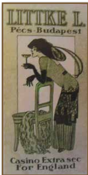
Littke pezsgő (For England) reklám