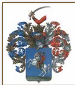
A Littke család címere

1912. április 27. A Littke család magyar nemességet kapott a királytól „Lőrincbányai” előnévvel. (Ezt az előnevet a pécsbányatelepi, egykori Littke tulajdonban lévő szénaknákról kapta a család.)