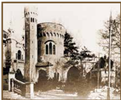
1896. A millenniumi kiállítás Littke pavilonja