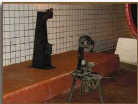
A pezsgőkészítés eszközei 2.