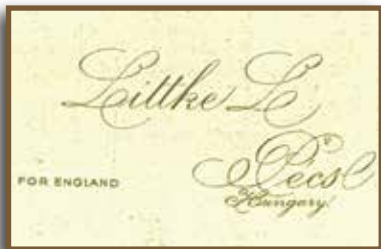
Littke For England pezsgőjének címkéje

Eredményes tárgyalásokat folytatott különböző pécsi befektetőkkel, minek eredményeként 1934. november 29-én létrejött a „Littke Pezsgőgyár Vezérképvisellete Kft.”