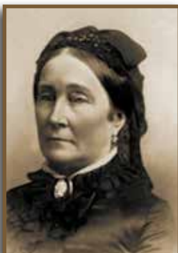
Egy világhírű pezsgő nagyasszonya, Louise Pommery

A pezsgő elterjedését jelentős mértékben elősegítették a napóleoni háborúk. Különben is a háborúk a pezsgőfogyasztást növelték. A szövetkezett hatalmak hadseregei 1814-ben, amikor Franciaországban voltak, átvonultak Champagne-on, és az ottani pezsgók tartalmát nagyon alaposan „tanulmányozták”. A finom italt sokan megismerték, és annyira megkedvelték, hogy a háború befejezése után hazájukban is megkívánták. Ennek hatására hatalmas rendelések keletkeztek Európa-szerte, ami a fogyasztás elterjedését hihetetlen mértékben növelte.