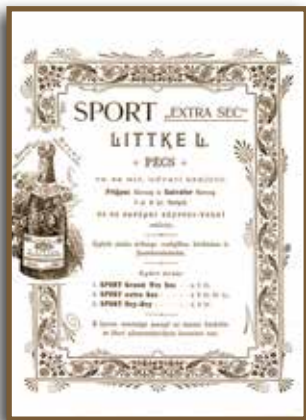
1893. A Littke Sport pezsgő reklámkártyája

„Littke L. Császári és Királyi Udvari Szállító Pecsztartó Társaság”.